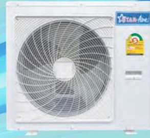
Model OR-305-A - OR-305-B