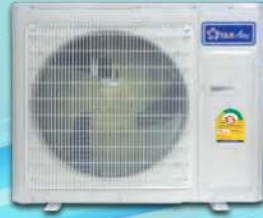
Model OE-185A - OE-255-A