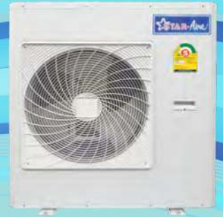
Model OR-365-A - OR-405-A Model OR-365-3A - OR-405-3B