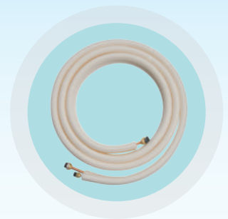
มีท่อร้อยสายสำหรับยาว 4 เมตรมากับเครื่อง